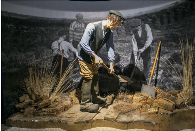
Onze groep begon met het natuurgedeelte.