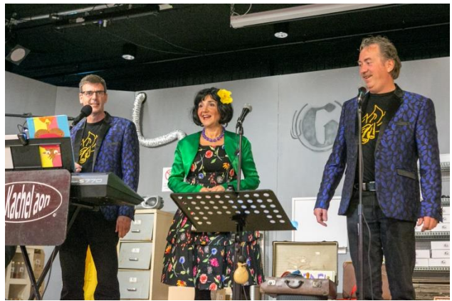
Optreden van De Kachel Aon