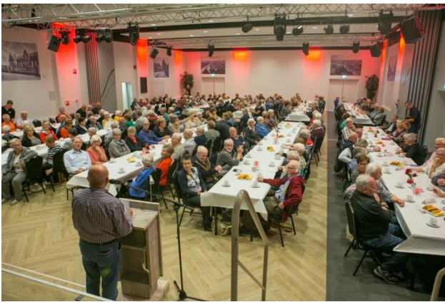
Een volle zaal